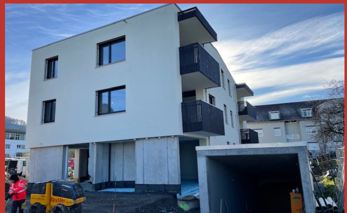
Aussenansicht der Wohnanlage