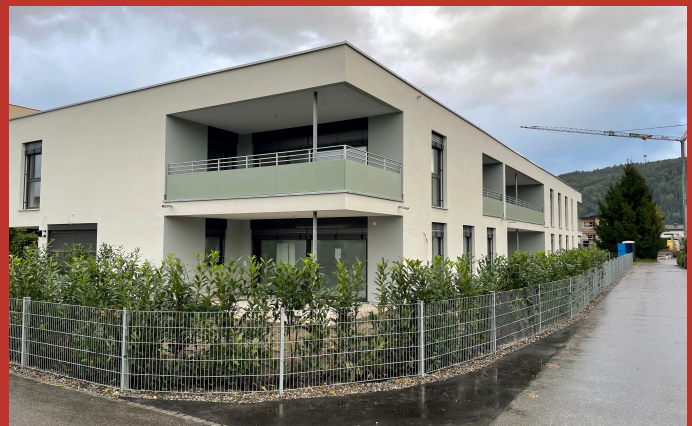
Die Kleinwohnanlage Austraße in Feldkirch Gisingen

BAM Betontechnik GmbH Industriestrasse 13 6840 Götzis T: +43 5523 21395 @: info@bam-betontechnik.at